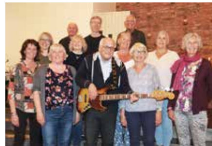
JUBILERER: Kor X feirer 30 års jubileum i år.