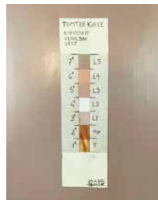
LAG PÅ LAG: Håndverkerne har skrapet seg bakover til eldre malingslag for å finne frem til dagens farge.

Det finnes linoljemalte hus i Norge som har stått i vel 300 år uten vedlikehold og fortsatt har heldekkende fasadefarge.