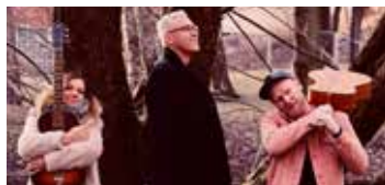
TONER: 12. desember spiller blant annet denne trioen i Eidsberg kirke.

23. desember: Eidsberg Bygdekor i Eidsberg kirke