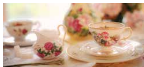
TE: Også i høst kan du være med på fellesskap over en kopp te i Askim.