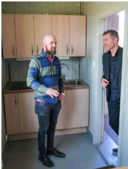
DÅPSSAKRISTI 2.0: Det lille dåpssakristiet ute i våpenhuset er blitt mer praktisk og trivelig.