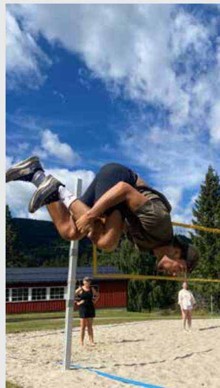
SVEV: Konfirmantleiren inneholdt ulike aktiviteter, noen mer luftige enn andre.

«Det sto klart for meg at dersom jeg ønsker at det skal være et barnemiljø i kirken, så må jeg være med å lage det selv.»