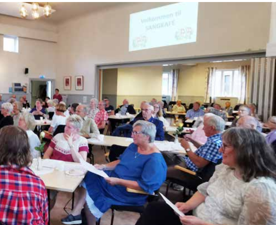
POPULÆRT: Det er mye aktivitet på Normisjonshuset i Askim sentrum. Her er det sangkafé.