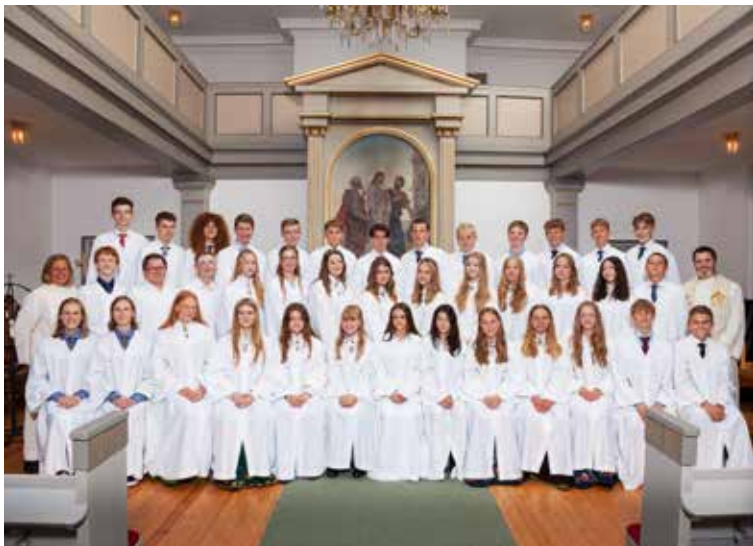
KAPPEKLEDD: Dette er årets konfirmanter i Spydeberg.