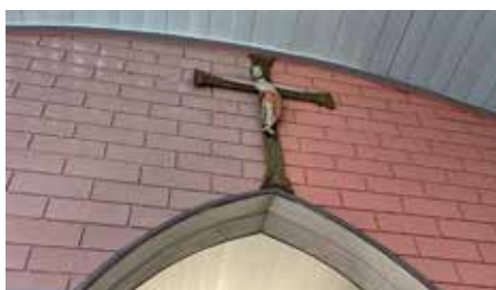
FORSKJELL: Underveis i malingen kunne man se forskjellen på ny (venstre) og gammel farge.